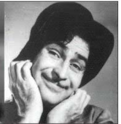
راج کپور کی فائل فوٹو