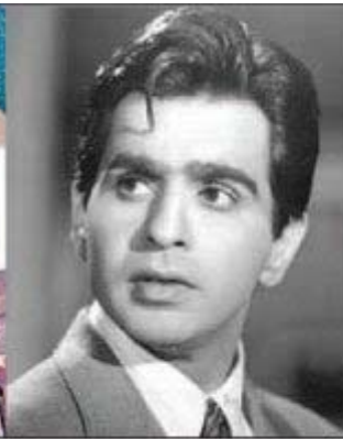
دلپسند کمار کی فائل فوٹو