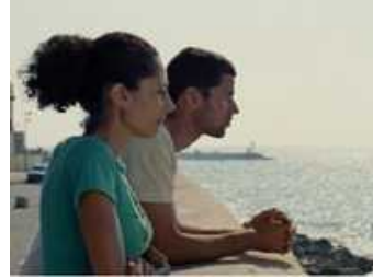
لقطة من الفيلم الفلسطيني (ملح هذا البحر)

القاهرة - تستضيف العاصمة المصرية القاهرة المهرجان الأول من نوعه لأفلام اللاجئين الذي يقام في الفترة من 16 إلى 20 حزيران/ يونيو الجاري بمشاركة 20 فيلماً وثائقياً وروائياً في ساحة روابط للفنون الأدائية بالتزامن مع الاحتفالات بذكرى اليوم العالمي للاجئين.