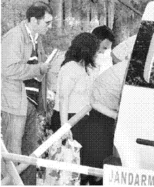
Abdullah Öcalan'ın avukatları İmralı'da yatan Öcalan'la görüşmeye giderken, onun istediđi kitapları da götürdü.