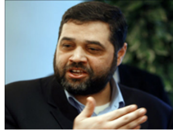
القيادي في حركة حماس أسامة حمدان

دمشق - أكد مسئول العلاقات الدولية في حركة المقاومة الإسلامية (حماس) أسامة حمدان أن حماس تثق بالوساطة الألمانية التي يجريها وفد أمني يتراوح عدده بين ثلاث وخمس شخصيات ينتقل بين حماس وإسرائيل من أجل إتمام صفقة تبادل الأسرى.