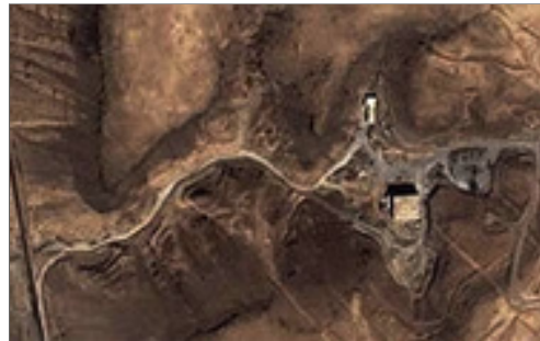
منطقة دير الزور كما صوره القمر الصناعي الأمريكي

صرح الناطق الرسمي باسم الوكالة الدولية للطاقة الذرية بأن أثار اليورانيوم التي عثر عليها في موقع (دير الزور) السوري الذي دمرته إسرائيل في عام 2007 تشير الي انه كان مفاعلا نوويا في مرحلته الاولى.