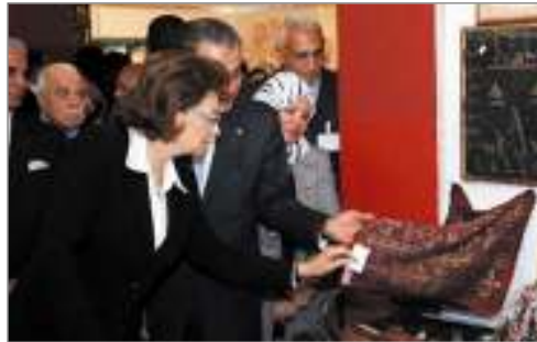
السيدة الفاضلة سوزان مبارك تتفقد بعض منتجات الأسر المنتجة خلال افتتاحها معرض ديارنا 2010

افتتحت السيدة سوزان مبارك قرينة رئيسة الجمهورية أمس، معرض الأسر المنتجة ديارنا2010 في دورته الرابعة والأربعين، والذي يستمر حتى 22 أبريل الحالي في أرض المعارض بمدينة نصر، ويشارك في المعرض هذا العام 7 دول عربية.