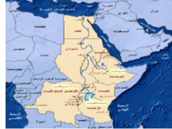
خريطة توضح دول حوض النيل

القاهرة- فشلت مباحثات دول حوض النيل الأربعة في التوصل إلى اتفاق إطاري لإعادة تقسيم مياه النهر بطريقة ترضي دول المنبع والمصب، فيما أصرت الأولى على توقيع اتفاق منفرد من دون مصر والسودان، وتمسك القاهرة بعدم المساس بحصتها من مياه النيل.