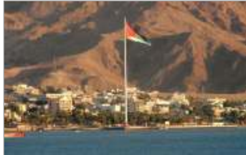
مدينة العقبة الأردنية

أكد مصدر مسئول تعليقاً علي ما تداولته بعض وسائل الإعلام حول سماع أصوات انفجارين صباح أمس شرق الحدود المصرية من جهة العقبة،