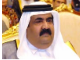
أمير قطر الشيخ حمد بن خليفة آل ثاني

لندن - القدس العربي - أظهرت برقيات دبلوماسية أمريكية سريها موقع ويكيليكس أن رئيس لجنة العلاقات الخارجية في الكونغرس الأمريكي السيناتور جون كيري، قال لمسؤولين قطريين ان مرتفعات الجولان يجب أن تعود إلى سورية وأن القدس الشرقية يجب أن تكون عاصمة الدولة الفلسطينية.