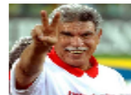
الجماهر المصرية تطالب على الفيس بوك بعمل تمثال وميدان باسم حسن شحاته