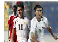
العراق مطالب بتحسين صورته والبحرين بالمرصاد في خليجي 20