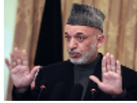
الرئيس الأفغاني حميد كرزاي

اوتوا- حذر دبلوماسي كندي في كابول من أن الرئيس الأفغاني حميد كرزاي يمكن أن يقطع التواصل مع حلف شمال الأطلسي نتيجة الوثائق الدبلوماسية الأمريكية التي نشرت مؤخرا، حسبما ذكرت صحيفة كندية الأربعاء. وقالت الصحيفة إن السفير الكندي في كابول وليام كروزبي نقل في مذكرة دبلوماسية قلقا عبر عنه نظيره الأمريكي كارل ايكنبيري. وكتبت المذكرة بعد اجتماع السفيرين السبت الماضي.