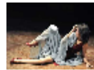
ممثلة مغربية تتعري على المسرح وتثير اعجاب عرب بلجيكا