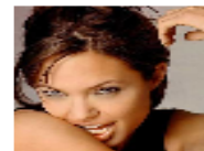
أنجلينا جولي ترفض الاحتفال بعيد الشكر بسبب قتل الاوروبيين للهنود الحمر