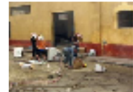
45 طائرة خاصة غادرت مصر خلال ساعات رفع حظر التجوال وفنانات يغادرن البلاد مزبد