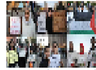
مبارك أخفق في وضع أساس لنقل السلطة