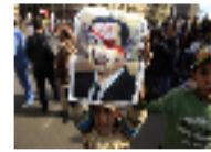
مصر: الانتفاضة وضعت حدا لطموحات جمال ومبارك بلعب بورقة الجيش لكن النجاح ليس مضمونا