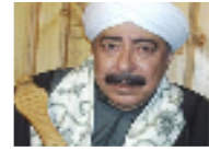
فانون من مصر يساندون ثورة الغضب في بلادهم