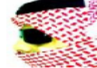
الحكم على أمير سعودي في فرنسا بالسجن ستة أشهر مع وقف التنفيذ