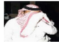
مصادر مغربية: السعوديون يحتلون المرتبة الثانية في قائمة السياح المقيض عليهم في جرائم أخلاقية