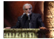
عمر الشريف يؤيد تحية مبارك