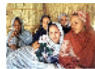
نساء الصحراء الغربية يتحدین التقاليد بالفتاء علنا