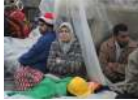
متظاهرون يخيمون في ميدان التحرير

القاهرة- تدفق الموظفون على منطقة وسط القاهرة التي تتركز فيها البنوك والمصالح الإدارية واصطف العملاء للتعامل على حساباتهم الأحد مع عودة البنوك المصرية للعمل بعد إغلاق دام أسبوعاً جراء احتجاجات سياسية. ويتأهب المصرفيون لفضي في غرف المعاملات النقدية مع خروج المستثمرين الأجانب ورجال الأعمال المحليين من الجنيه المصري بعدما أصابت الاحتجاجات معظم الاقتصاد بالشلل وجفت مصادر مهمة للنقد الأجنبي.