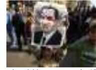
مصر: الانتفاضة وضعت حدا لطموحات جمال ومبارك يلعب بورقة الجيش لكن النجاح ليس مضمونا