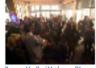
اسلاميون يطالبون بإغلاق الملاهي والمرافق بالأردن ومطالبة شبكات الدعارة