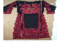
مصمم أزياء شاب يجسد التقاليد الفلسطينية بطريقة حديثة