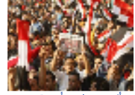
علم مصر أكثر مبيعا من أي وقت مضى وسط الاحتجاجات والاحتفالات