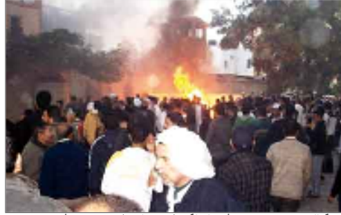
أسنة اللهب تتصاعد من مبنى أمن الدولة بمطروح والمواطنون يتجمعون أمامه

هاجمت جموع من المواطنين مقر جهاز أمن الدولة في مدينة نصر، والإسكندرية، والجيزة، وأكتوبر، والشيخ زايد، والشرقية ومطروح، كما جرت محاولة لاقتحام مقره في مدينة طنطا.