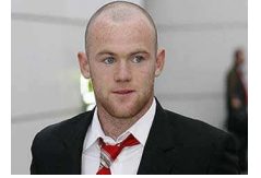
روني يحارب الصلح بزراعة الشجر