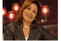
الهام شاهين تريد عمرو موسى رئيساً لمصر