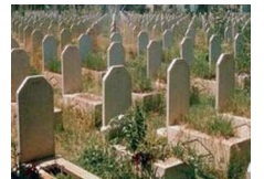
أب أردني يصب طفله باعاقه ذهنية بعدما إصطحبها للمقابر ليلا نكاية بالأم

القذافي يقسم على البقاء في طرابلس "مينا أو حيا" ◀ زهير ادراوس: المطالبه بمنع الساتيه زعيبي من المشاركة في أسطول الحرية الثاني لأنها شاركت في الحملة "الإرهابية" الأولى