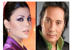
علي الحجار: تراجع العري دفع الفنانة وعلى رأسهن هيفاء وهبي للحشمة