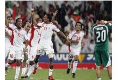
الفيفا يرفض طلبا إماراتيا لتسهيل تجنيس اللاعبين