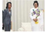
القذافي كان يعيش قصة حب من طرف واحد مع كوندليزا رايس والعتور على 4 البيومات لها بفرقة نومه