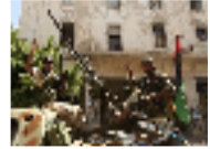
بعد سقوط القذافي.. من يقدر على توحيد ليبيا