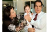
مجلة فرنسية: بن علي يواطئ على الصلاة وسيطلق ليلى الطرابلسي