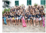
جميلات العالم بالبرازيل لاختيار ملكة جمال الكون وطرد إيطالية من المسابقة بعد ظهورها عارية