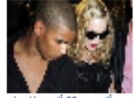
مادونا تنفق أكثر من 80 ألف دولار على عطلة عائلة عشيقها الجزائري