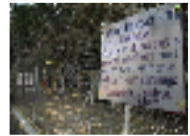
عمال أوروبيون عالقون في بغداد يعيشون "كالحيوانات" على تبرعات