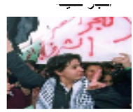
اردني يقتل ابنته الارملة بعد ولادتها لتوأم "تطهيرا للشرف"