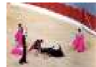
فضل الملوك والعاثكان في منعها ونجح البرلمان ... كاتالونيا تضع حدا نهائيا للعبة مصارعة التيران