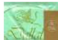
شركة إسرائيلية تكتب البسملة على ورق الحمامات