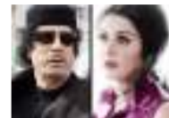
القذافي عرض شراء أفلام سعاد حسني "الإباحية" من صفوت الشريف بمائة مليون جنيه