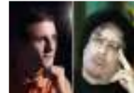
مطرب ليبي حطم أسنانه ليهرب من الغناء للقذافي