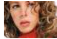
سوزان نجم الدين تنفي طلاقها بسبب ثورة سورية وتؤكد ان الخير "شائعة مفبركة"