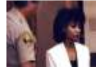
عارضة أزياء أمريكية من أصل مصري تقتل زوجها وتطبخ جسده وتأكله تطلب الصحف