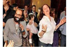
طلاق أبو الليف وعلا رامي بعد عام واحد من الزواج