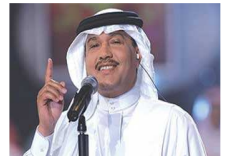
شائعة حمل زوجة محمد عبده الجزائرية تغزو بلاكيري"