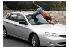
أمريكية مقيمة في الأردن تدهس ثلاثة أطفال وتقتل أحدهم لانهم تشاجروا مع ابنها