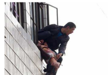
مصري يلقي بناته من الطابق السادس لشبكة في نسيهن بعد 15 عاما زواجا