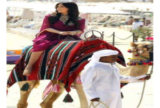
الممثلة الأمريكية كيم كارداشيان تدخن الشيشة وتركب جملا بالإمارات وتشيد بجمال النساء العربيات