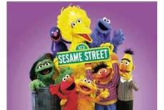
مشاهد إباحية تقحم موقع "شارع سمسسم" على "يوتيوب"