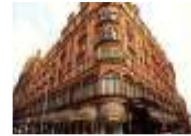
مهرجان مغربي في منجر هارودز الراقى في لندن