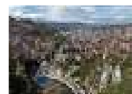
سرايفو تستعيد مشاعر مدينة متعددة النفاذات