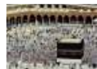
مصنع سعودي يتخصص في نسج وتطريز كسوة الكعبة المشرفة