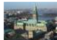
حى هافن سيتي في هامبورج مقصد جديد للسانحين