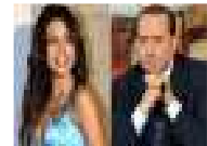
29 مذبة جديدة في القضية التي بنتهم برلسكوني فيها بممارسة الجنس مع مومس قاصر