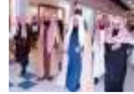
الجلد والسجن لعضو بالشرطة الدينية السعودية لتحرشه بامرأة