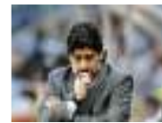
وفاة والدة مارادونا بعد تعرضها لأزمة قلبية