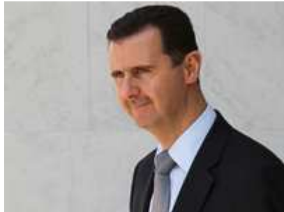
الرئيس السوري بشار الأسد

الجزائر - (يو بي اي): اتهم المتحدث باسم جماعة الإخوان المسلمين السوريين زهير سالم نظام الرئيس السوري بشار الأسد بـ"حماية" حدود إسرائيل، قائلاً إنه لهذا السبب يعجز العالم حتى الآن عن إيجاد بديل له. وأوضح سالم في حديث نشرته صحيفته (الشروق) الجزائرية الإثنين أن "تردد العالم في التعامل مع القضية السورية يؤكد الدور الوظيفي لهذا النظام".