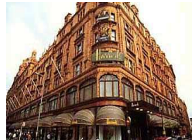
مهرجان مغربي في متجر هارودز الراقى في لندن