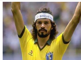
وفاة سقراط قائد البرازيل السابق عن 57 عاما