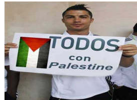
رونالدو يبيع حذائه الخاص ويتبرع بتمنه لاطفال غزة