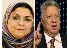
مرتضى منصور المرشح المحتمل لرئاسة مصر لناشطة سياسية: "هديكى بالجزمة"