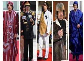
رحلة مصممة ليبية من سجون القذافي لعالم الأزياء في باريس