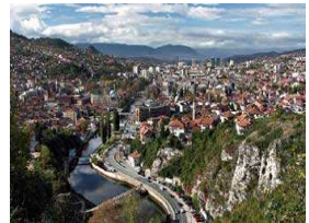
سرايفو تستعيد مشاعر مدينة متعددة الثقافات