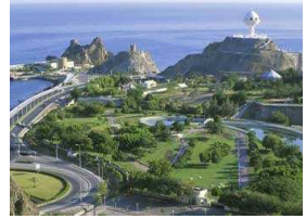
الربيع العربي ينعش السياحة في سلطنة عمان