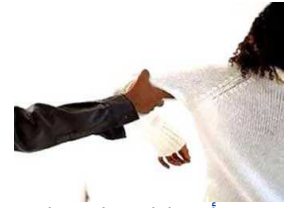
مصرية تستأجر بلطجية لاغتصاب زوجة عشيقها أمام عينيها