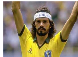
وفاة سقراط قائد البرازيل السابق عن 57 عاما