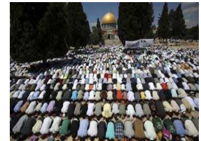
حكومة تننياهو ستصادق على قانون منع رفع الأذان عبر مكبرات الصوت