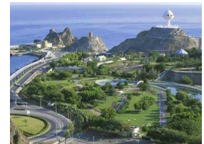
الربيع العربي ينعش السياحة في سلطنة عمان