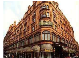
مهرجان مغربي في متجر هارودز الراقى في لندن