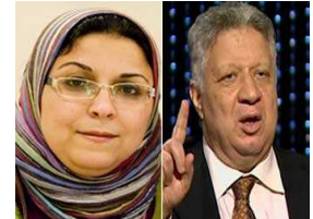
مرتضى منصور المرشح المحتمل لرئاسة مصر لناشطة سياسية: "هديكى بالجزمة" مزيد