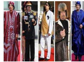
رحلة مصممة ليبية من سجون القذافي لعالم الأزياء في باريس