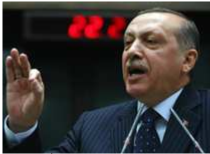
رئيس الوزراء التركي رجب طيب أردوغان

الدوحة- (د ب أ): ركزت الكلمة التي ألقاها رئيس الوزراء التركي رجب طيب أردوغان أمام المنتدى السنوي الرابع لمؤتمر "تحالف الحضارات" التابع للأمم المتحدة في العاصمة القطرية الدوحة على ضرورة إحلال السلام في الشرق الأوسط. وفي كلمته التي وجهها للمؤتمر عبر الفيديو طالب أردوغان الأحد بإحلال السلام في الشرق والأوسط وحل المشكلات المزمنة في هذه المنطقة بشكل سريع حتى يعم السلام في العالم اجمع.