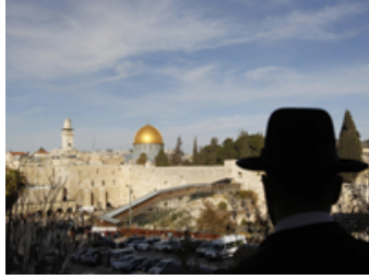
يهودي ينظر إلى جسر باب المغاربة في القدس

حزب الله يدين مشروع قانون إسرائيلي يهدف لإعلان القدس عاصمة موحدة للشعب اليهودي 2011-12-27