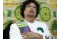
الجزائر: 8 فرق تشارك في دورة لكرة القدم أطلق عليها اسم "الشهيد معمر القذافي"