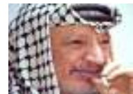
فيلم "تمن الملوك: ياسر عرفات" عن حياة الزعيم الفلسطيني الراحل