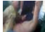
فيديو يصور القذافي عاريا قبل اغتياله بشرعيا واتهامات لعائشة بنه لتشويه صورة التوار