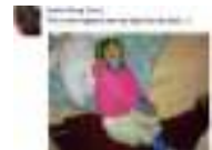
أمريكي يكتم ابنه وبغدها للتسلي على "فيسبوك" والشرطة تحقق معه