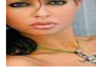
ملكة جمال مليبية المغربية تعرى على صفحات مجلة إسبانية