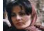
فدوى سليمان ممثلة سورية "تبحث في الشارع عن صرخ بوجه النظام"