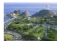
الربيع العربي ينعش السياحة في سلطنة عمان