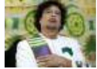
الجزائر: 8 فرق تشارك في دورة لكرة القدم أطلق عليها اسم "الشهيد معمر القذافي"