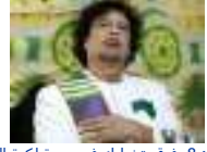
الجزائر: 8 فرق تشارك في دورة لكرة القدم أطلق عليها اسم "الشهيد معمر القذافي"