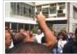
لبنان: مياومو كهرياء لبنان الأثنين ٣٠ يوليو ٢٠١٢