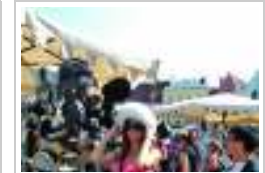
Street Fashion الأربعاء ٨ أغسطس ٢٠١٢ 0 صورة