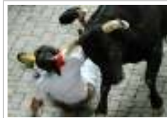
تجدي لثيران لجامحة في لبنان: مياومو كهرياء لبنان الأربعاء ١١ يوليو ٢٠١٢ 7 صورة