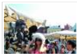
Street Fashion الأربعاء ٨ أغسطس ٢٠١٢ 0 صورة