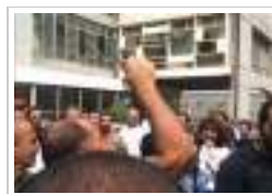
لبنان: مياومو كهرياء لبنان الأربعاء ٢٠ يوليو ٢٠١٢