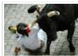
تحدي الثيران الجامحة في لبنان: مياومو كهرياء لبنان الأربعاء ١١ يوليو ٢٠١٢ 7 صورة