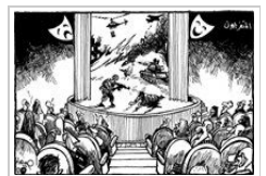
حبيب حداد السبت ٢٠ أكتوبر ٢٠١٢