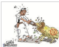
ناصر خميس السبت ٢٠ أكتوبر ٢٠١٢