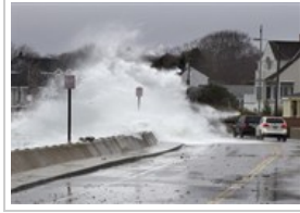
الاعصار ساندي الثلاثاء ٢٠ أكتوبر ٢٠١٢ 12 صورة