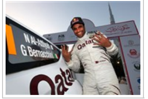
رالي دبي يتوج السبت ١ ديسمبر ٢٠١٢ 4 صورة