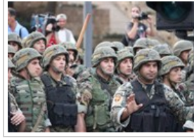
متظاهرون يحاولون إقنحام الأحد ٢١ أكتوبر ٢٠١٢ 8 صورة