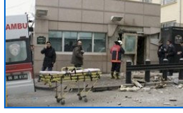
Patlamadan sonraki tüm görüntüler