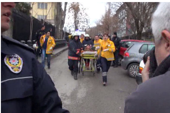
ESKİ TV MUHABİRİ PATLAMADA YARALANDI