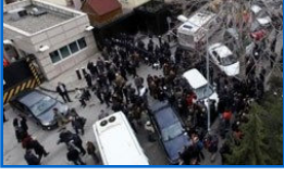
ABD Büyükelçiliği'nde canlı bomba saldırısı: 2 ölü