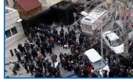
Patlamanın olduğu kapının özelliği