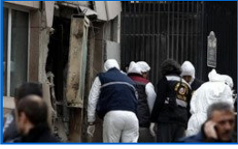
Görgü tanığı patlama anını anlattı