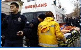
Olay yerinden ilk fotoğraflar