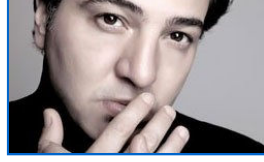
'Türkiye için üzücü bir dava'