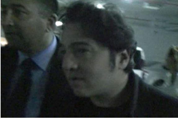
ADLİYEYE BÖYLE GELMİŞTİ