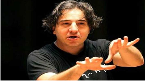
FAZIL SAY'A 10 AY HAPİS