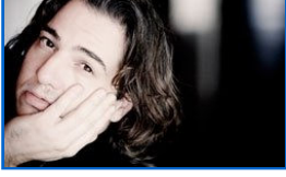
'Fazıl Say otistik olabilir araştırılsın!'