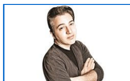
Tweet'e 1.5 yıl istendi