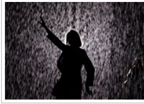
السير تحت المطر من دون