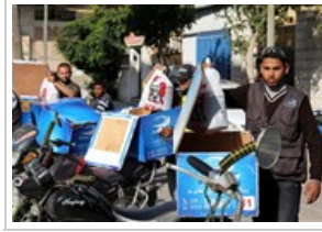
"الكنناكي" في غزة