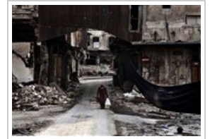
امرأة من حلب.. مفعمة الأحد ٤ أغسطس ٢٠١٣ 0 صورة