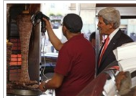
كيري "يتغذى" شاورما الخميس ٢٢ مايو ٢٠١٣ 5 صورة