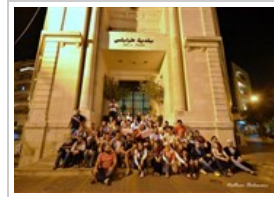
"صوّر ع الماشي"... عن الثلاثاء ٢٣ يوليو ٢٠١٣ 6 صورة