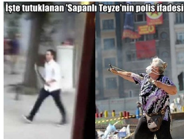
İşte tutuklanan 'Sapanlı Teyze'nin polis ifadesi