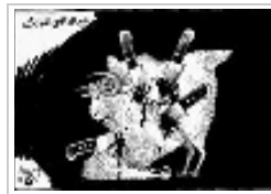
حبيب حداد الثلاثاء ١٥ أكتوبر ٢٠١٢