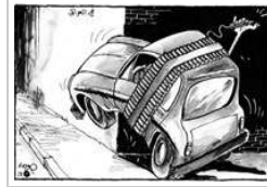
حبيب حداد الأحد ٢٠ أكتوبر ٢٠١٢