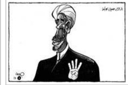
حبيب حداد الثلاثاء ٢٢ أكتوبر ٢٠١٢