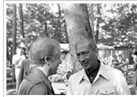
من مجموعة صور نشرتها الجمعة ١٥ نوفمبر ٢٠١٣ 3 صورة