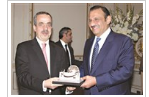
هدايا تقديرية من الأمير خالد الأحد ١٧ نوفمبر ٢٠١٣ 10 صورة