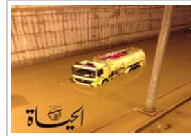
«الحياة» تنقل بـ«الصور»... الأحد ١٧ نوفمبر ٢٠١٣ 15 صورة