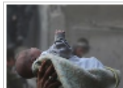
بالصور.. انتشار رضيع حي