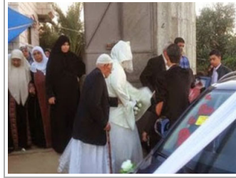
في غزة.. لم يحضر العريس فرقت العروس مع صورتها