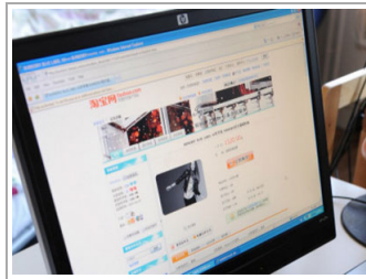
عشق للانحار على موقع صني