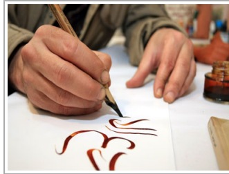
فن الخط المغربي .. بحث عن التحديد وحصانة لمكانة الحرف العربي

التي تزرع لإنتاج الغذاء أو الزيوت أو الأعلاف) فإن ما يتم إنتاجه لا يمثل سوى 4 من إحتياجات القطاع، وذلك نظراً لحاجة هذه المحاصيل لعناصر مهمة كـ 'المساحات الشاسعة، والمياه الوفيرة'، وهو ما لا يتوفر في أراضي غزة. ولفت أبو شمالة إلى أن وزارة الزراعة تستغل المساحات الشاغرة، الموجودة في المناطق الحدودية مع إسرائيل، لزراعتها بالمحاصيل الحقلية، إذ تزرع '35 ألف دونم، سنويا، بهذه المحاصيل، ويعمل فيها 4 آلاف عامل. وأكد أن سعر المنتجات الزراعية من الخضار والفواكه في سوق قطاع غزة مناسب، كما انها تتميز بالجودة العالية. ويخضع قطاع غزة لحصار فرضته إسرائيل منذ فوز حركة المقاومة الإسلامية (حماس) في الانتخابات التشريعية عام 2006، وشددته عقب سيطرة الحركة، على القطاع في صيف العام 2007. ولا تسمح إسرائيل سوى بإدخال عدد وكميات محدودة من إحتياجات القطاع عبر المعبر، وتمنع إدخال مواد البناء، والمواد الخام الخاصة بالمصانع.