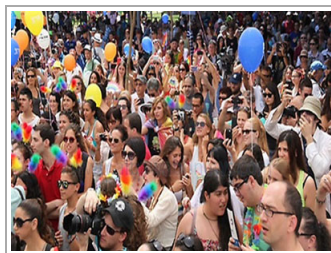
تل أبيب عاصمة "الشذوذ الجنسي"