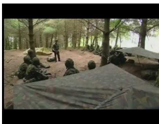
الارتباك في صفوف الجنود البريطانيين