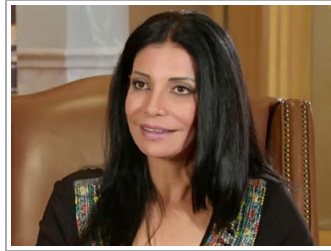
سوسن بدر تمنع الصحفيين من تغطية عزاء شقيقها