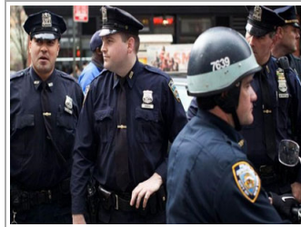
السلطات الأمريكية تعتقل شاب سعودي بتهمة الاعتداء الجنسي على طالبة