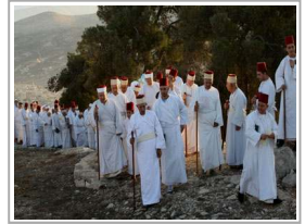
المسامريون يحجون إلى قمة "جرزيم" بنابلس احتفالاً بعيد "العرش" اليهودي

على حسن الفوز سيرة الشاعر في «التألق على الزين» لمحمد علي شمس الدين