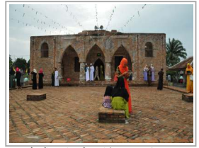
مسجد "كروسي" شاهد على تاريخ المسلمين ومعاباتهم في تايلاند