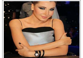
ثعبان نانسى عجم يد 20 ألف دولار