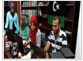
العمل الاعلامي في ليبيا - تدعى سفح الحريات وتزيد الانتهاكات