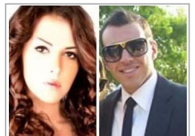
زوج دنيا سمير غانم اجازتفا كانت غم