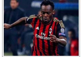
حقيقة أصلية لاعب ميلان مايكل إيسيان بالابو لا