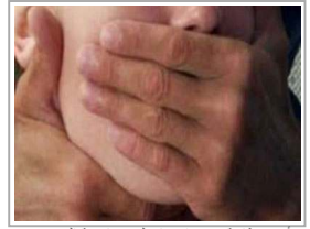
أم بريطانية تجبر ابنتها على ممارسة الجنس مع 1800 رجل