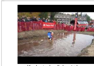
مسابقة حمل الروجات في امريكا