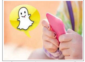
الكويت تحذر قياتها من نشر صور هن على "سناپ تشات"