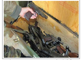
أسلحة تنظيم "داعش" ... مصادر متبوعة والهدف واحد