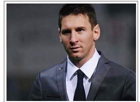
ميسي يرحح كاكسا امام الجميع