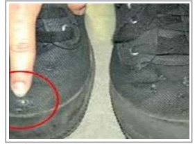
مسجن مهندس فرنسي بدمان بسبب ادماته على تصوير ما تحت "فساتين" الفتيات