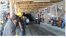
O madenin sahibi konuştu

Kurtulan arkadaşımızdan birisi benim akrabam. Nereye kaçtılar, can havliyle ne yaptılar bilinmiyor. Diğer işçilerin kaçmadığını anlattı bana. Öbür arkadaşları bu kadar sudan korkulur mu dediler dedi, ben kaçtım dedi. Bazı insanların canı tatlı olur ya, hemen kaçarlar korkarlar. Diğer arkadaşlar herhalde aldırış etmemişler. Hani bir laf varya 'kaçanın anası ağlamaz' diye bazı arkadaşlarımız kaçır, bazıları da ne olacak der. Vahim bir olay olmuş keşke olmasaydı.