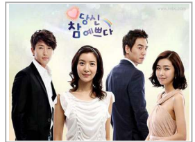
إعدام 50 شخصا في كوريا الشمالية لمشاهدتهم مسلسلات أجنبية