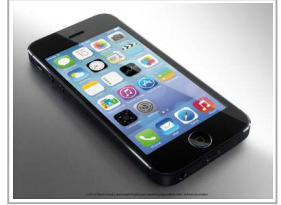
فقدت هاتفها في بريطانيا وجنته في الصين