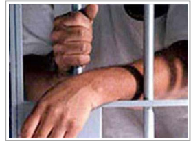
عائلة مغربية "قتل" ابنها لإنقاذه من السجن