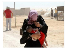
بين لاجئي سوريا... العجز يعانون وطأة الحرب ونيد المجتمع