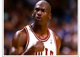
مايكل جوردن يستولي على لقب تيمية الحظ