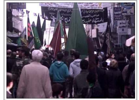
عاشوراء" دمشق : سواد وتشديد أمني ولطميات