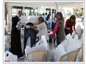
«كتر خيرك» مبادرة شيبانية لإغاثة العائلات البيناوية المحتاجة