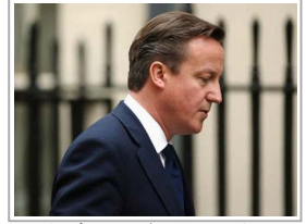
حلاق يرفض قص شعر رئيس الوزراء البريطاني وتجله