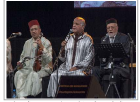
"المطر وز الغرناطي" شعر شغني بالعربية والحيرية من وحى تحاليف المسلمين واليهود بالأندلس