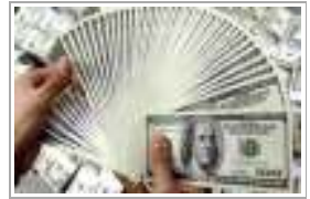
4 كرتية كسب هو ضارب 150 ألف لار بعد فشل عملية جليل