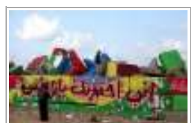
4 غرة لون «و» خلفه «الحر»