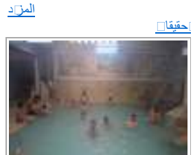
4 في ياه «الحا» التوسية تشفاء ترخاء عبر العصور