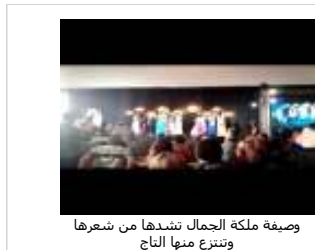
وصيفة ملكة الجمال تنبها من شعرها وتنتزع منها التاج