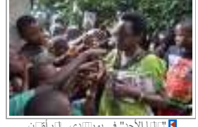
4 «البا الأحد» في يورادى «أرأق» «التوسى» فتح أراضيها لاف «الهور»

بتنفيذ الهجوم رغم حقيقة أن الجماعة المسلحة المرابطة بتنظيم الدلة الإلابة هي التي أعلنت سوليتها عن الهجوم، نشر صوراً لإثبات ذلك. كما أن الصحيفة إلى أن جماعة الإخوان المسلمين «ارعت لإلابة تنظيم الدلة» سلمي بناء بتمرار بسبب تخذهم للعنف. كما أن لك الجماعة بدها نققد الإخوان المسلمين. تهم هذه الجماعة الإخوان بالتركيز على التغيير السلمي التصاعدي (ن القاع إلى القمة)، نعتيها بأنها لا تحب كثيرا جنابة الحكون العلمانية الغربية. قالت الصحيفة إن الإخوان المسلمين، الفصل الإللابي الألبى المعارض، فالبالا بإلتخابا العامة، قبل أن قوا السبسي هيمنة عسكرية على الحكم عام 2013، غالبابا عمد إلى إلقاء اللوم على الجماعة لأى عنف ناهض للحكومة. قالت «في صرنا حان عذبة له نذ هجما مام بناء، بدا السبسي بننا، غاضبا، أصر على أن «صر» دفع ثمن» هاء حكم «ماعة إرهابية»، في أ ج قوا، في إارة علة لعز الجيش للمحمد ربي. أضما السبسي أن قاة الإخوان حذر قبل أبيع عز ربي ن «لب أس ن مع العالم» لمحاربة المصريين، ن أقطار مثل أفغانستان العراق ورتا فلسطين ليبيا. حلا بكتيبة من المسولين العسكريين، هم السبسي أضما لا نبية لم كشف عنها بالتحرض على الهجوم. وأو أ صار السبسي بتمرار إلى الحكون قطر ركبيا السوان بدعم الهجوم.