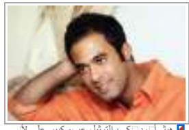
إهم إمد ك: التمثيل عب كبير على إاي إجل إمد ك