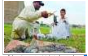
4 رفة حكمة كفاة لباكستاني اصطفاة ألف فـ