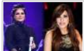
إلان إباء إاجوي ك وإمهون الأخيرة