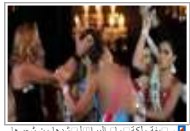
وصيفة ملكة ماليا إلال تنبها من شعرها وتنتزع التاج عقب إعلان النتائج