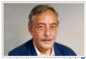
إخاد الصاوي إتر في خير وفاة إميل آاب