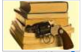
4 قرار السماح للمعلم بقتل الأيذه في إنكا