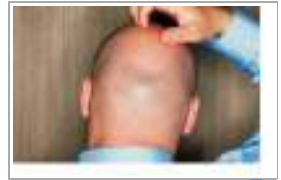
4 قاعة إجابة طلب الخلع بعد 48 ساعة من الزواج "أصلع" في أصنع