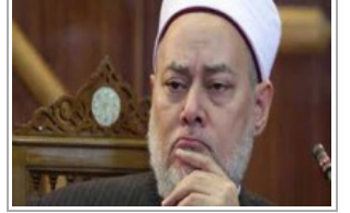
مفتي مصر السابق علي جمعة: فديو حرق الطيار الأردني "فوتوشوب"