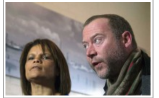
آباء في أوروبا يواجهون محنة بعد اغراء أبنائهم بالجهاد في سوريا