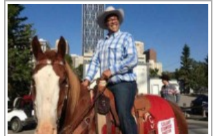
أفضل رئيس بلدية في العالم كندي مسلم