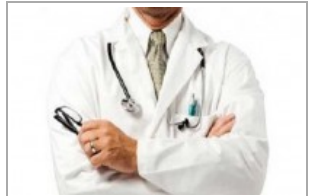
معلم سعودي ينهي حمله مع طبيب يضرب صيد