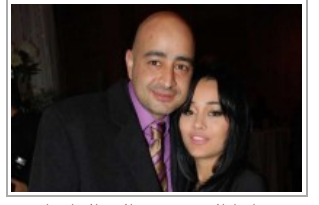
راند الحري تعود الى والد امها