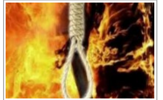
شيق مسين ميني وحرق زهجة الستينية في تعز