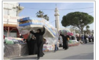
لاحتات سوريات في لبنان: بلطان لمن تقليدية تمنع عنهن ذل السؤال

الوثيون بتعطيل الشرعية الدستورية في البلاد».