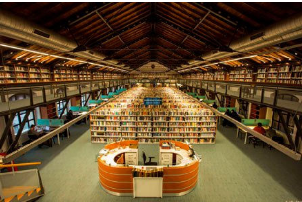
(Kadir Has Üniversitesi Kütüphanesi)

Bu yıl 51'incisi düzenlenen "Kütüphane Haftası" kapsamında açılacak olan sergi, 5 Nisan'a kadar görülebilir.