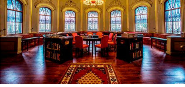
(Ahmet Hamdi Tanpınar Kütüphanesi)

51. Kütüphane Haftası 29 Mart 2015 Pazar günü, İstanbul Büyükşehir Belediye Bاندosu eşliğinde, Tünel Meydanı'ndan saat 14.00'te geleneksel "İstanbul Kütüphaneleri Yürüyor" programıyla başlayacak. 5 Nisan'a kadar devam edecek etkinliklerle ilgili ayrıntılı bilgi, kutuphanehaftasi.istanbulkutuphaneci.org adresinden öğrenilebilir.