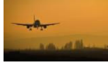
Rusya'dan Ukrayna'ya misilleme