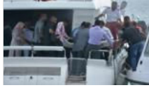
Devlet Başkanı'nın teknesinde patlama