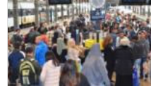
İsveçliler mültecilere karşı silahlandı