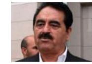
İbrahim Tatlıses'ten flaş vekillik kararı