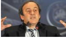
'Platini görevden alınıyor'

YAZARLAR SİYASET TÜRKİYE DÜNYA EKONOMİ KÜLTÜR-SANAT ÇİZERLER SPOR YAŞAM BİLİM-TEKNIK SAĞLIK FOTOĞRAF VIDEO SOKAK GEZİ