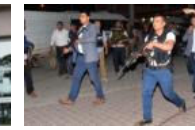
Polise silahlı saldırı: 2 şehit