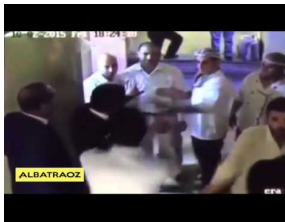
نائب أردني واخوته يعقدون بالضرب على عامل مصري في العقبة