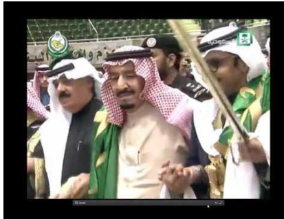
مشاركة الملك سلمان في رقصة العرضة السعودية خلال مهرجان الجنادرية