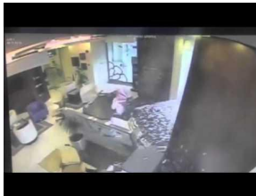
سيارة تتحطم مصراً في السعودية... و"حظ خارق" لموظف البنك